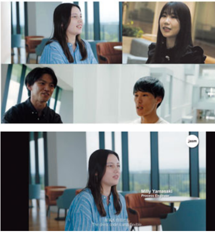
ホームページリンク https://www.tsmc.com/static/japanese/careers/jasm/voices.html

就職を機に、思いがけず熊本にUターンする形になりましたが、故郷・天草の家族や友人の近くに居れることは何より幸せだな、と思っています。東京は私の第二の故郷です。私の弟妹も現在大学生で、東京で頑張っています。また東京に戻って皆様にご挨拶出来る日を楽しみに、日々精進して参ります。