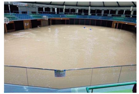
アロマ体育館の水害時の状況

な状況ではあります。が、一日も早い復旧に向け、全力で取り組んでいるところでございます。しかし、松島町には明るい話題