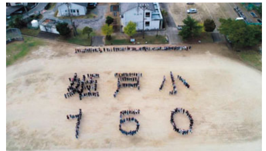
姫戸小150周年の人文字

健やかな成長を願う地域の皆様、温かいご支援とご協力を賜りながら、令和7年（2025年）に150周年という大きな節目を迎えることができました。