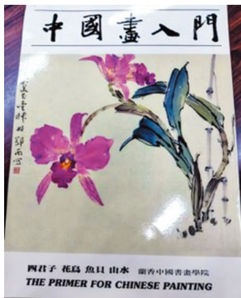
テキスト本を發行

●プロフィール 天草出身、台北に書画留学。筆芸術の教育を目的とした「蘭香書画学院」を設立。国際書画連盟常任理事・審査員、MBA協会事務局長、東亜芸術研究会日本代表。