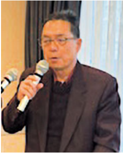
塚本副会長兼幹事長