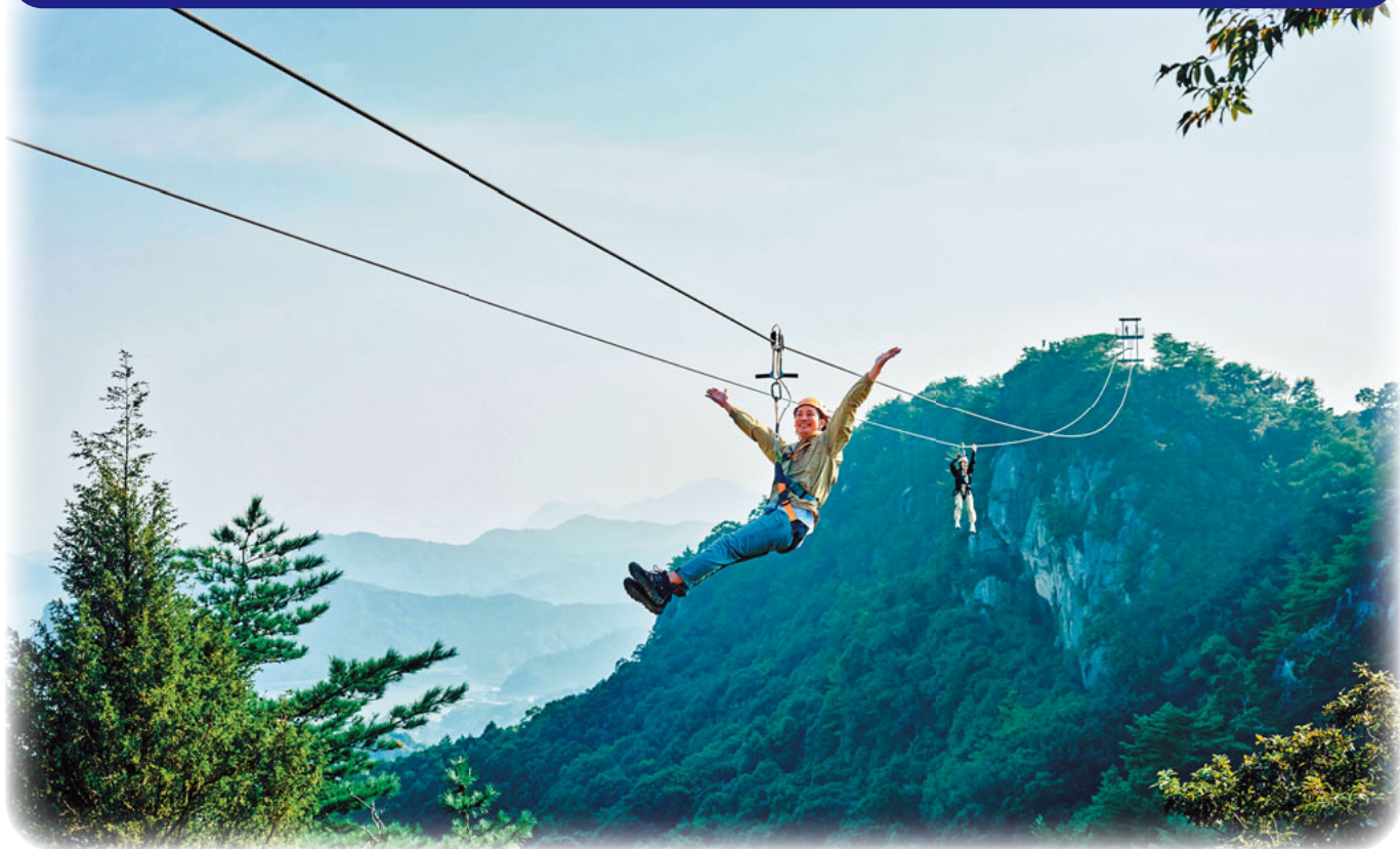
天空ジップライン「白嶽」