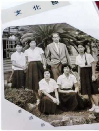
書道部恩師長久先生と

記事が載った中華日報を持って文部大臣や美術界の代表とも会いました。そして30人の書画家から作品を贈呈され、5人の師匠から書、山水画、花鳥画、四君子等を学ぶ事になりました。こうして妙にのさった優遇を受けることができたのです。