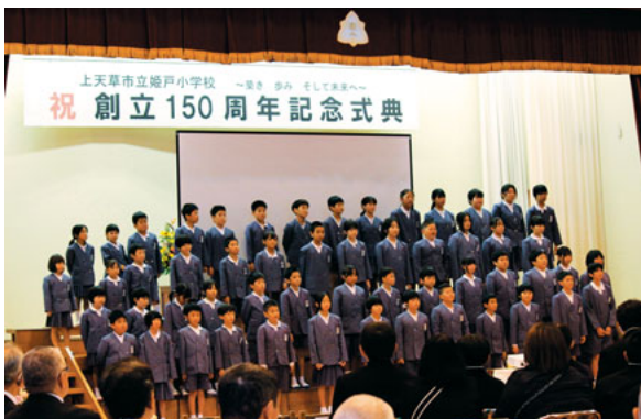
150周年記念式典の様子

姫戸小学校の歩みは、明治7年の二戸小学校、翌8年の姫浦小学校創立に始まり、昭和34年には両校が統合され、現在の姫戸小学校が誕生しました。平成22年には牟田小学校が統合され、時代の変化に応じた歩みを重ねてきました。今でも「学校、家庭、地域」が一体となった教育活動が息づいています。この長い歴史を支えてこられた先