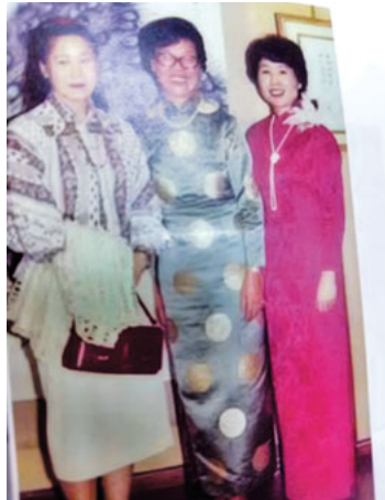
花鳥画の林老師と銀座の師弟展で