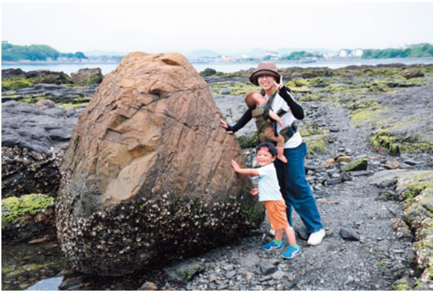
苓北の観光名所・おっぱい岩に大興奮の来場者

当日は、地元西川内地区の皆さんによる「がね揚げ」の販売や加工品、地元農産物などのグルメ販売のほか、町外からの出店者やキッチンカーが立ち並びました。また、会場周辺では「かずま園」も開放されるなど、多くの家族連れで大賑わいとなりました。