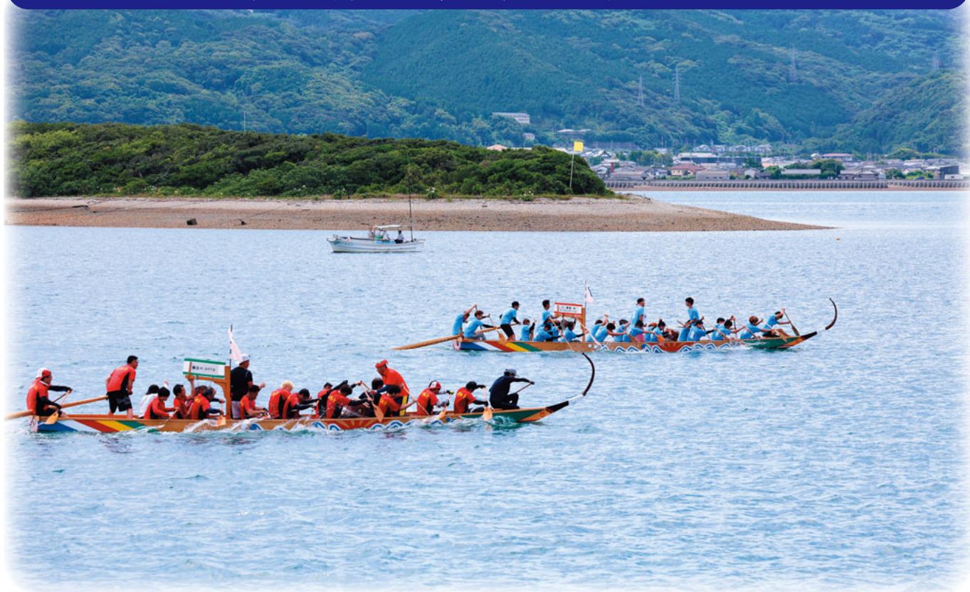
苓北町じゃっと祭