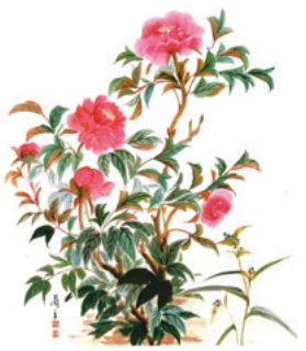
なまず・書・牡丹は寄贈作品

「お母さん、こんな小さな掛け軸を拝んで効き目があるの?」ときくと「紙に一万円と印刷したら一万円の価値があるように、書かれている内容に力がある」と母はいうのです。(つづく)