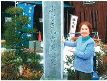
石碑の字は藤沢市長でお手本は蘭香