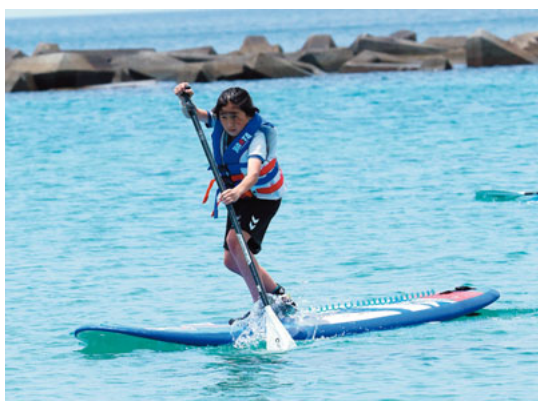
海上でのSUPを楽しむ参加者

また、同日には一般社団法人天草れいほく観光協会武林代表理事など関係者出席のもと、海開き(安全祈願祭)も執り行われました。