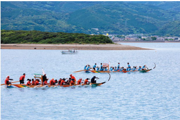
ペーロン競漕で激漕を魅せる選手ら

2日目には、富岡港巴湾を会場に「第37回天草苓北ペーロン大会」が開催され、町内をはじめ、友好姉妹都市である佐賀県唐津市や長崎市から計20チームが出場し、白熱したレースを繰り広げました。「よいしょー」の掛け声と共に、太鼓や銅鑼がにぎやかに打ち鳴らされ、往復500メートルのコースを駆け抜けました。