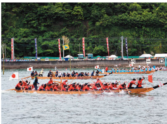
相生市の地元チームと熱戦を繰り広げる「天草苓北ペーロン」チーム(手前側)